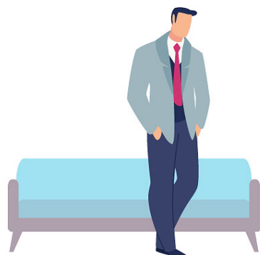
4. ПРОВОДИТЕ ВРЕМЯ В СТОЯЧЕМ ПОЛОЖЕНИИ