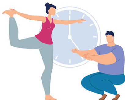
1. ДЕЛАЙТЕ КОРОТКИЕ АКТИВНЫЕ ПЕРЕРЫВЫ

Физическая активность помогает нам поддерживать как физическое, так и психическое здоровье